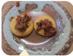
ピリ辛! リッツと合う~♡

以前の機関誌で、かぐら南蛮の食べ方についてみなさんにお聞きしましたが、先日赤くなった実を「南蛮味噌」に調理し、リッツの上のせていただきました。