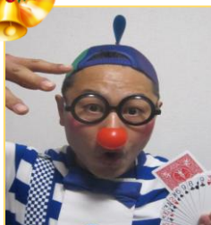
クラウンねんじさん